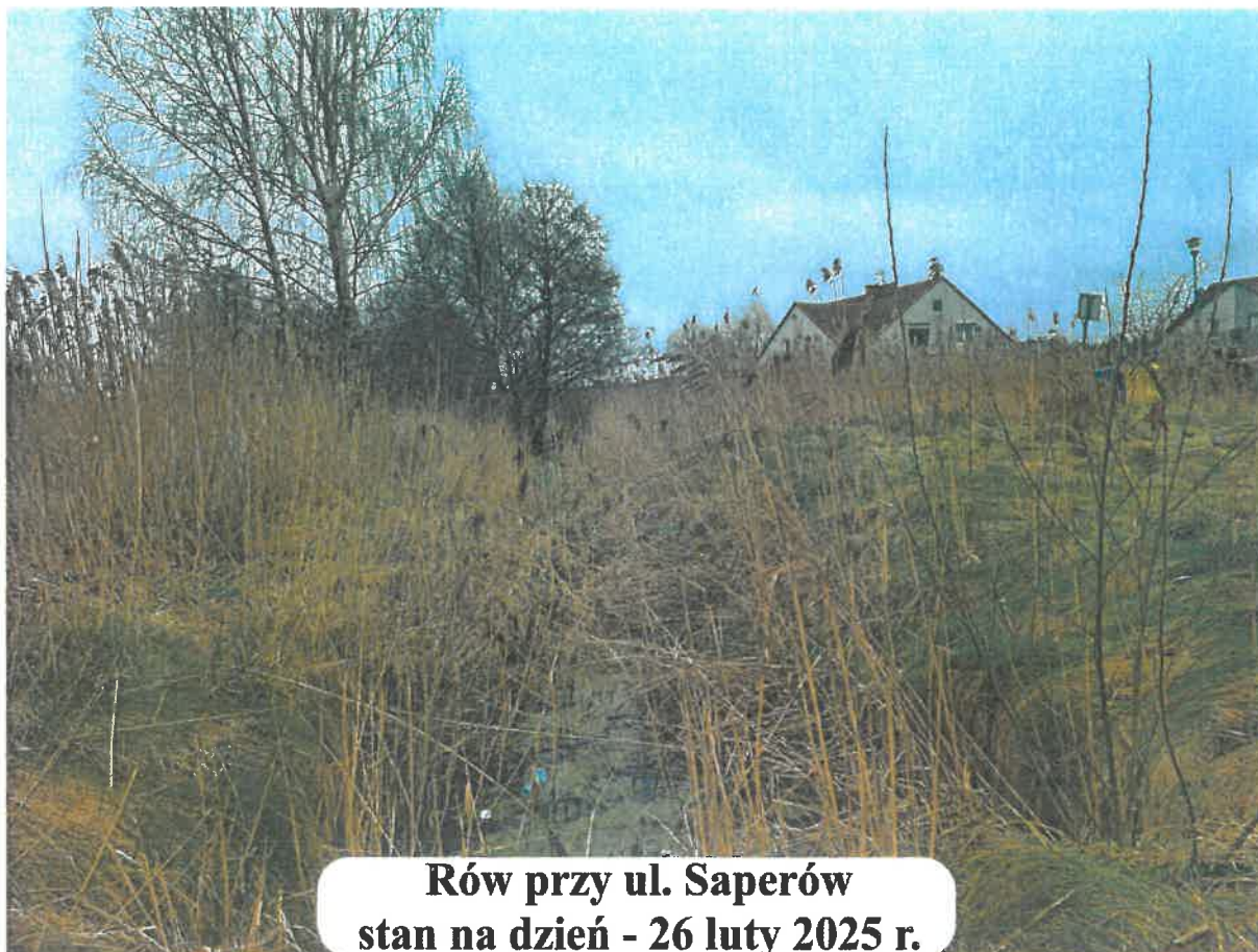
Rów przy ul. Saperów stan na dzień - 26 luty 2025 r.