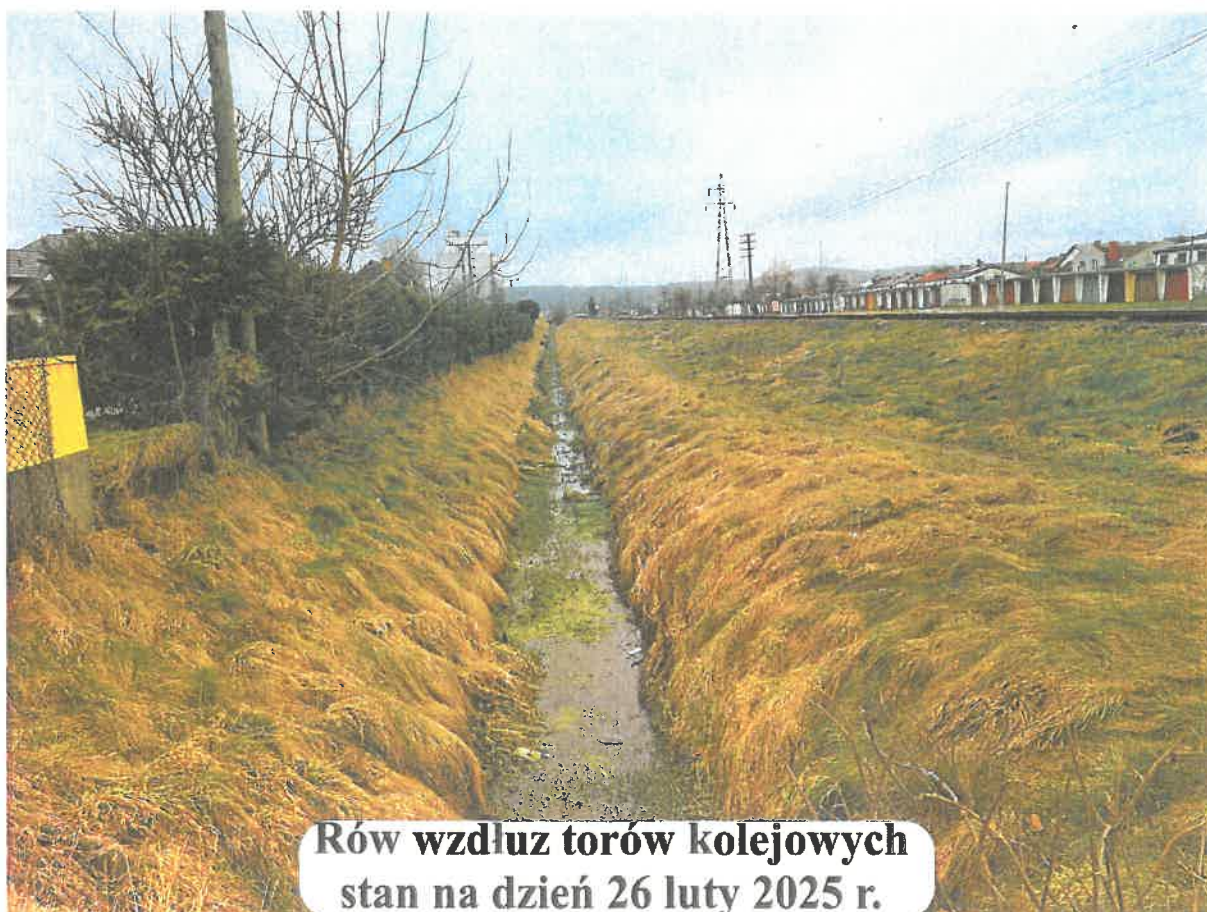
Rów wzdłuż torów kolejowych stan na dzień 26 luty 2025 r.