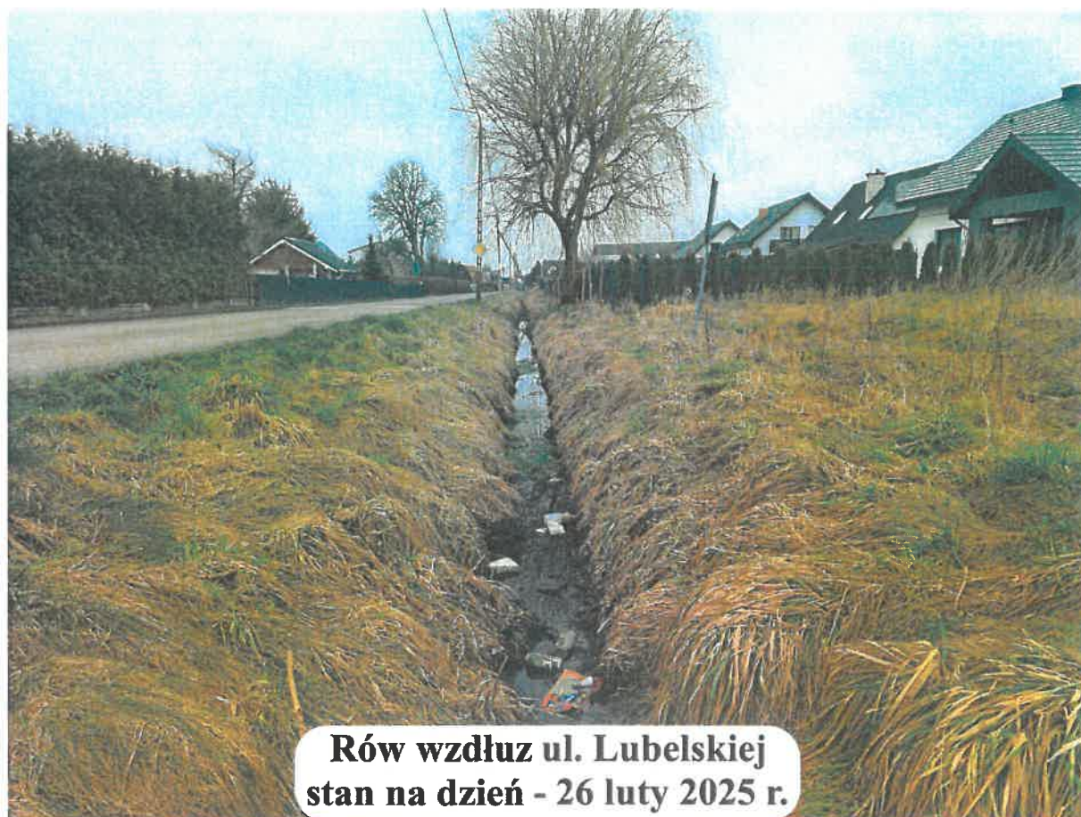
Rów wzdłuż ul. Lubelskiej stan na dzień - 26 luty 2025 r.