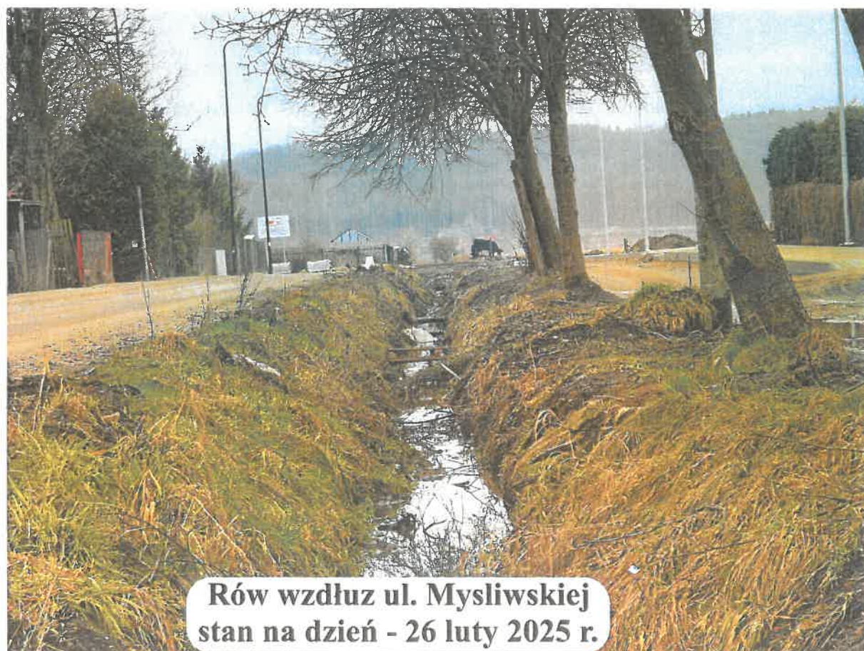
Rów wzdłuż ul. Mysliwskiej stan na dzień - 26 luty 2025 r.