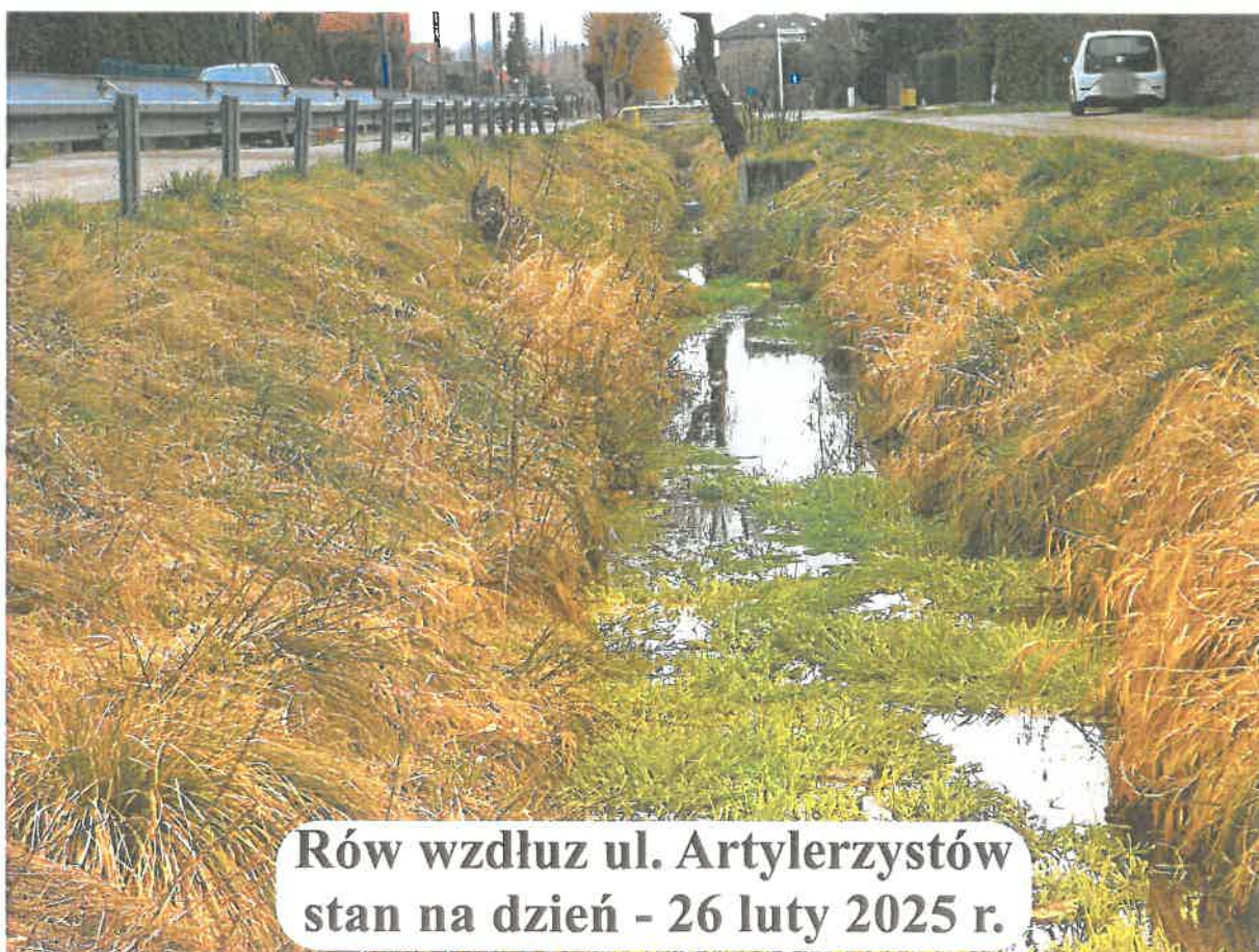
Rów wzdłuż ul. Artylerzystów stan na dzień - 26 luty 2025 r.