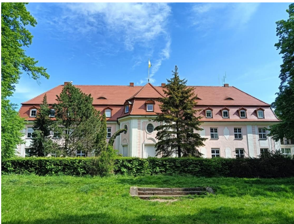
Budynek Starostwa Powiatowego, widok od strony parku, fot. 05.2024.