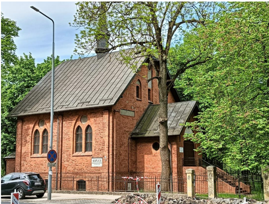
Kaplica cmentarna , ul. Wojska Polskiego 47, widok w kierunku zachodnim, fot. 05.2024.