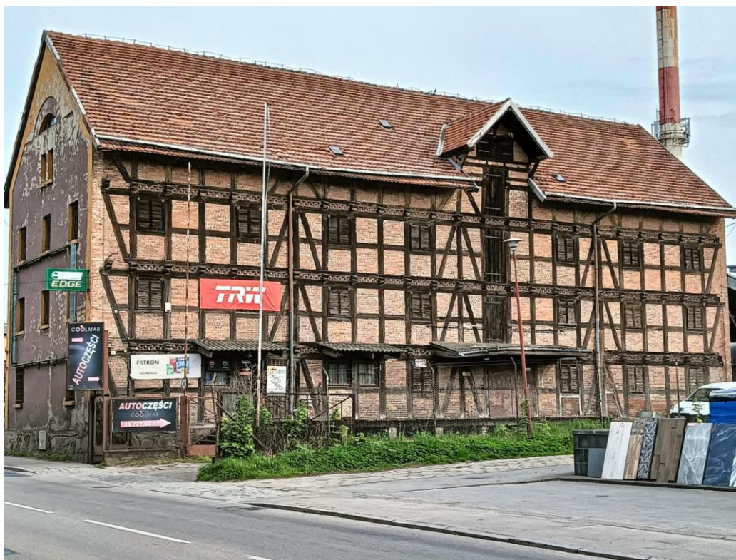
Spichlerz, ul. Kossaka 23, widok w kierunku północnym, fot. 05.2024.