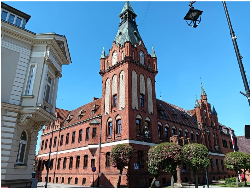
Ratusz, widok w kierunku północnym, fot. 05.2024.