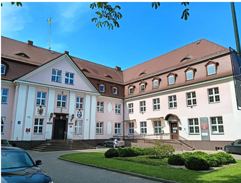
Budynek Starostwa Powiatowego, widok w kierunku SW, fot. 05.2024.

podpiwniczony, z użytkowym poddaszem. Dach mansardowy, kryty dachówką karpiówką. Od strony elewacji ogrodowej pięcioboczny ryzalit, zwieńczony osobnym dachem mansardowym. W skład zespołu obok budynku głównego wchodzi również wozownia, która razem z budynkiem głównym i jego skrzydłem tworzą założenie na rzucie litery „U”. Od strony południowej zlokalizowany jest park.