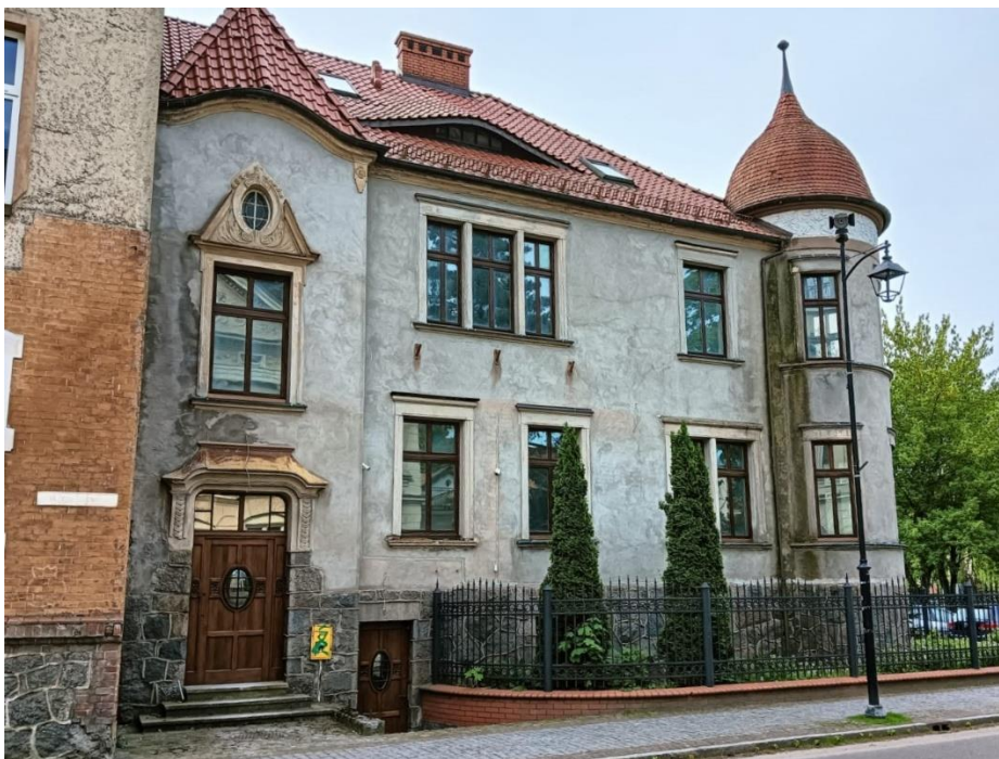
Budynek dawnej przychodni rejonowej, ul. Armii Krajowej 15, widok w kierunku S, fot. 05.2024.

Zbudowany ok. 1918 r., po pożarze poprzedniego budynku, w stylu neoklasycystycznym. Do 1945 r. należał do Jana Caspera, właściciela banku i wytwórni alkoholi. Wzniesiony z cegły, otynkowany, przekryty dachem czterospadowym (dachówka karpiówka). Dwukondygnacyjny, na planie prostokąta, z wieżą od strony zachodniej. Elewacje bogato zdobione detalem neoklasycystycznym, parter boniowany.