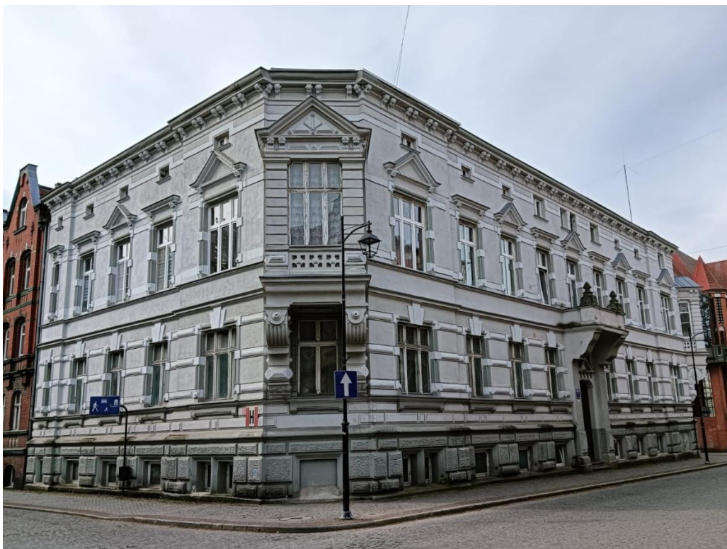
Kamienica przy ul. Armii Krajowej 7, widok w kierunku S, fot. 05.2024.