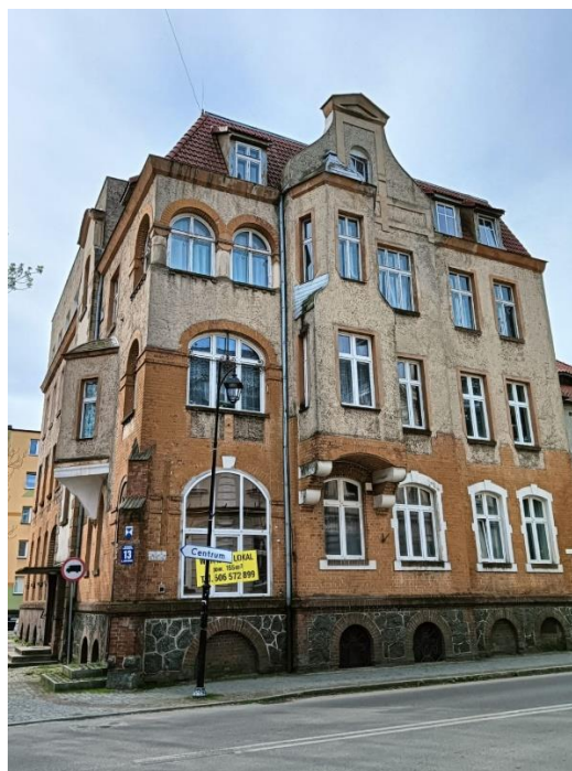
Kamienica, ul. Armii Krajowej 13, fot. 05.2024.