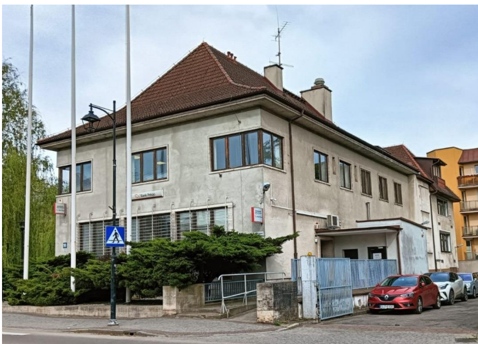
Budynek banku, ul. Armii Krajowej 18, widok w kierunku północnym, fot. 05.2024.

Wzniesiony na pocz. XX w., z secesyjnym wystrojem, z cegły, otynkowany, fundamenty kamienne, ściany poddasza w konstrukcji szkieletowej. Budynek złożony z dwóch brył: dwukondygnacyjnej przekrytej dachem kolankowym, od południowego zachodu – jednokondygnacyjnej, przekrytej dachem mansardowym. W narożniku zachodnim wieża na planie koła, nakryta cebulastym hełmem. W części wschodniej elewacji od ul. Armii Krajowej ryzalit pozorny.