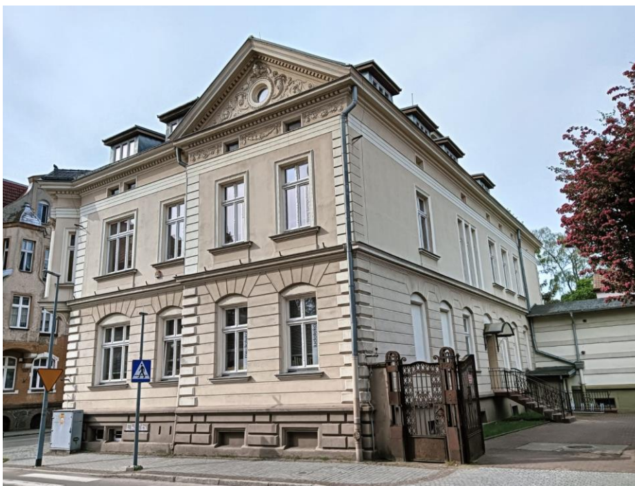
Budynek Miejskiej Biblioteki Publicznej, ul. Armii Krajowej 16, widok w kierunku SW, fot. 05.2024.