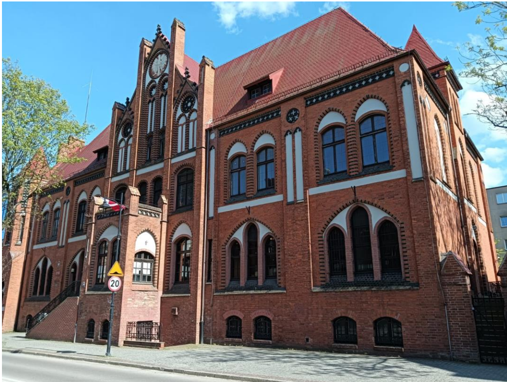
Budynek poczty, ul. Armii Krajowej 11, widok w kierunku NE, fot. 05.2024.