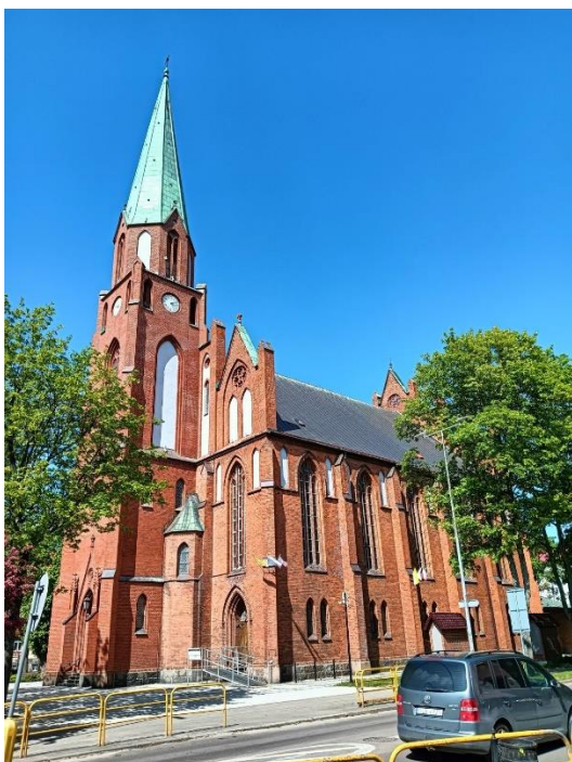
Kościół par. NMP, fot. 05.2024.

Wzniesiona w 1900 r. jako budynek mieszkalny dla pracowników poczty. Murowana z cegły, otynkowana, na wysokim ceglano-kamiennym cokole, trójkondygnacyjna, przykryta dachem wielopołaciowym. Założona na planie prostokąta. W elewacji północnej (frontowej) dwukondygnacyjny wykusz wsparty na wydatnych wspornikach. W dachu na osi środkowej neobarokowy szczyt. W elewacji bocznej wschodniej pseudoryzalit, obok trójkątny szczyt.