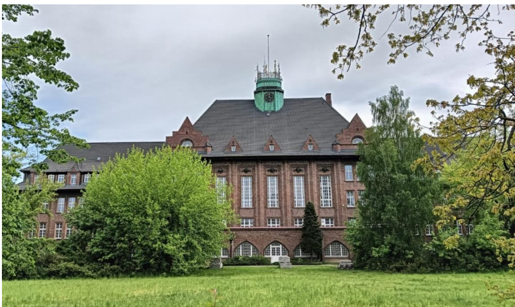
Budynek I LO w Lęborku, ul. Dygasińskiego 14, widok w kierunku NE, fot. 05.2024.

Wzniesiony w 1905 r., w stylu neogotyckim nawiązującym do form późnego gotyku z elementami secesji. Po II wojnie światowej rozebrano murowaną bramę od strony północno-zachodniej. W latach 60-tych XX w. dobudowano od strony ul. Skłodowskiej-Curie nowy budynek poczty przeznaczony na biura, przebudowany pod koniec XX wieku. Budynek poczty wzniesiony został z cegły, licowany cegłą z glazurowanymi elementami dekoracyjnymi. Dwukondygnacyjny, wysoko podpiwniczony, kryty dachem czterospadowym. W elewacji frontowej na osi ryzalit pozorny poprzedzony jednokondygnacyjną dobudówką, mieszczącą główne wejście do budynku. Wschodni narożnik zaakcentowany pseudoryzalitem, przechodzącym w drugiej kondygnacji w ośmioboczną wieżyczką. Układ wewnątrz regularny, trakty komunikacyjne w skrajnych osiach. Częściowo zachowana stolarka i metalopalstyka.