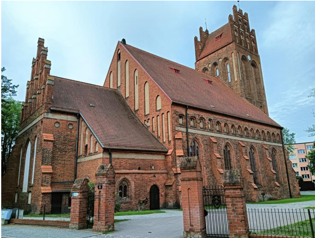
Kościół pw. Św. Jakuba, widok w kierunku SW, fot. 05.2024.